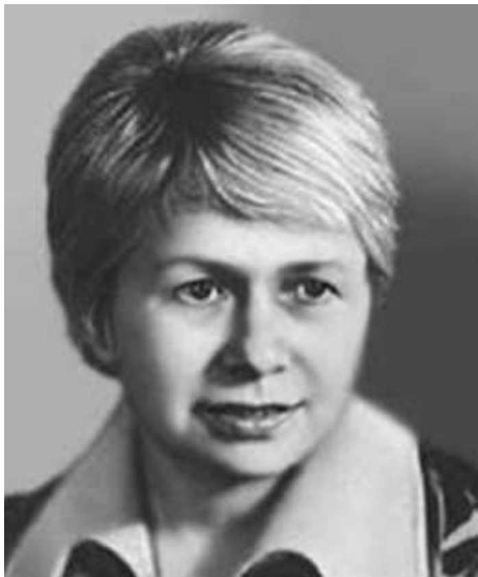
АЛЕКСАНДРА ПАХМУТОВА и НИКОЛАЙ ДОБРОНРАВОВ

9) Назовите авторов песни “Белоруссия”, которая начинается словами: “Белый аист летит, над белесым Полесьем летит”.