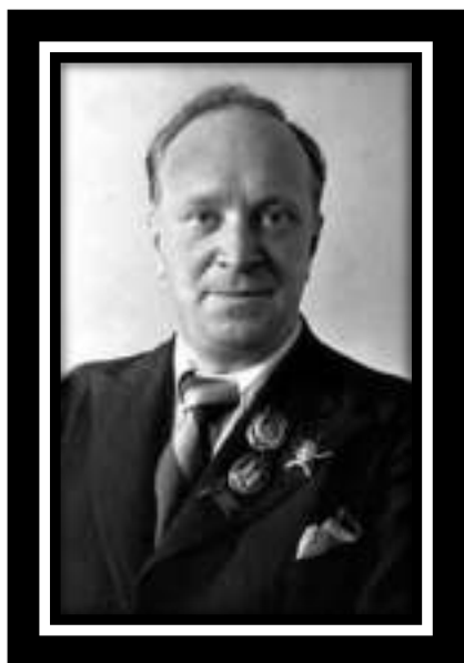
Василий Иванович Лебедев-Кумач

Название песни «Священная война» музыка А.Александрова, слова В Лебедева-Кумача. Стихотворение в газете прочитал руководитель Краснознаменного ансамбля песни и пляски Красной Армии А. В. Александров.