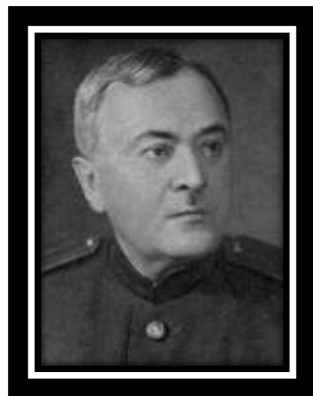
Александр Васильевич Александров

Название песни «Священная война» музыка А.Александрова, слова В Лебедева-Кумача. Стихотворение в газете прочитал руководитель Краснознаменного ансамбля песни и пляски Красной Армии А. В. Александров.