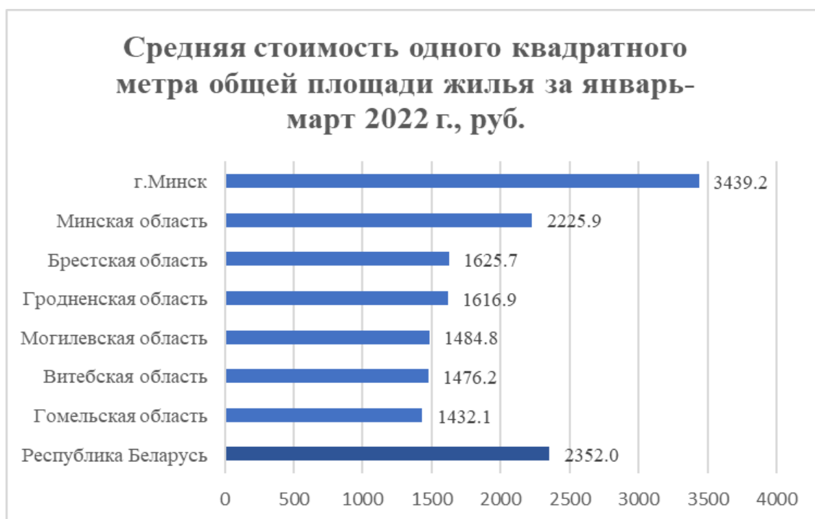
Рисунок 1 – Средняя стоимость 1 кв.м общей площади жилья (январь–март 2022 г.)